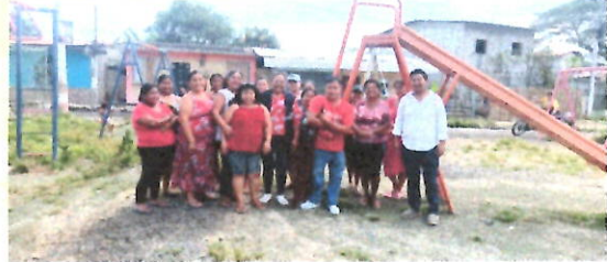
NOTE 40 Pro