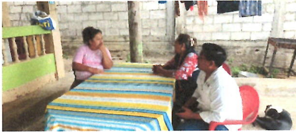
NOTE 40 Pro

Las balsas de abajo su presidente solicito que se construya un parque entre la autopista y la ciclovía se le manifestó que eso es servidumbre y que no debía ocuparse que se verifique otro espacio o en su defecto se le haría unas jardineras.